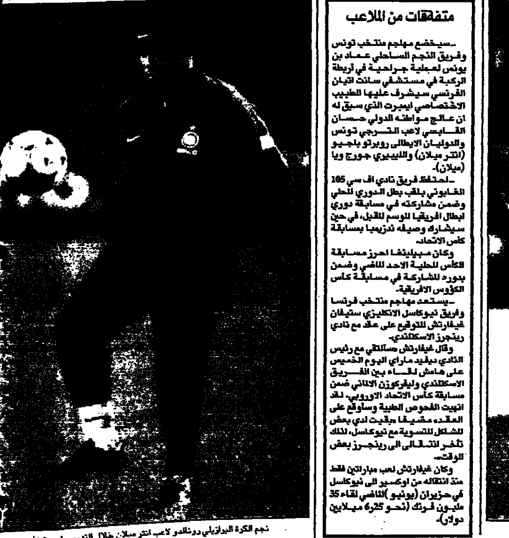
نجم الكرة البرازيلي رونالدو لاعب انتر ميلان خلال التصويب

■ وينديج - مونتريال - رويترز: بدأ منظمو دورة ألعاب بان امريكا محاولات مضنية لاتخاذ قرارات متسامة مع كرة القدم في مناسبات كرة القدم في البطولة الذي قام بجولة مع ممثل فيفا هوجو سالسيدو ان مسالة اضافة تسعة الاف مقعد مؤقت الى استاد بان امريكا في مونتريال لكررة القدم في البطولة التي تقام في الصيف المقبل. وقال فيفا ان اعداد البطولة سبب نقص الملاعب والاعتماد على مقاعد مؤقتة وهي مخاوف ظهرت بعد قيام فيفا في الشهر الماضي بالتوقيع على اللوائح. وكان منظمو البطولة يتوهمون القامة على ملاعب كرة القدم لرجال المسجات والحد من اضرار قذائف في ضربة تخصص على ملاعب من مناسبات. وقال جون مكيرزي الرئيس التنفيذي لدورة ألعاب بان امريكا مشعر ممثل فيفا ان ملعبا واحدا لن يتحمل اقامة جميع المباريات. ورغم ذلك لا تتفق بالضرورة المباريات.